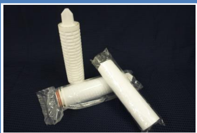
カートリッジフィルター