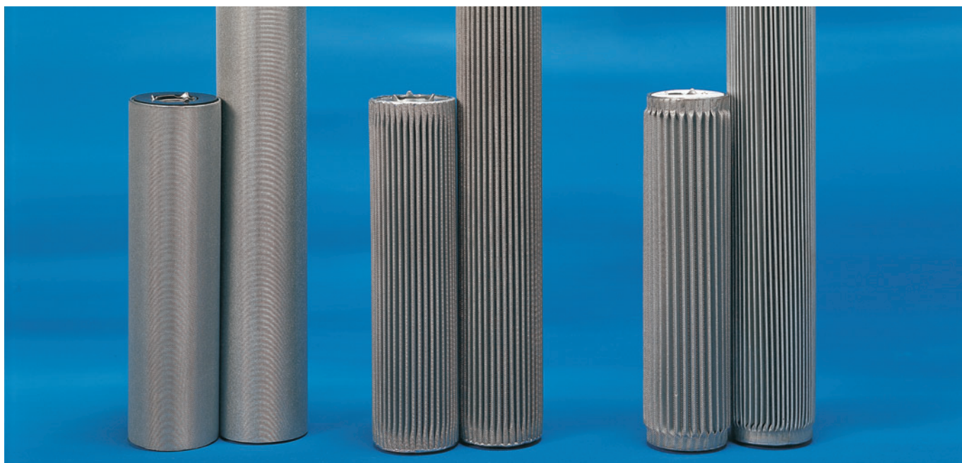
ダイナロイ(円筒タイプ)

スチーム、溶剤、粘性流体、高温・極低温流体、腐食性流体 半導体、化学工業、石油精製、発電用金属フィルター